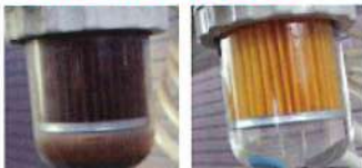
ストレーナー洗浄前(左)、洗浄後(右) ※上記画像はストレーナー交換した場合です。