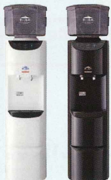
ブライトホワイト ダークブラウン